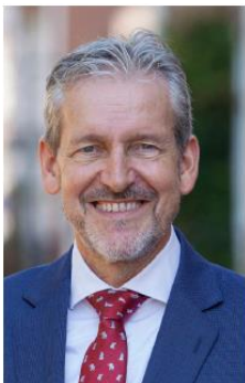
Burgemeester Hans van der Pas

Het bestuur van de gemeente wordt gevormd door het college van burgemeester en wethouders en de gemeenteraad. Het college van burgemeester en wethouders (college van B&W) is vergelijkbaar met het kabinet. Het college regeert en vormt het dagelijks bestuur van een gemeente. Hieronder volgt de samenstelling van het college van B&W op 1 juli 2023.