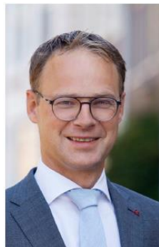
Wethouder Gert van Laar (SGP)

Portefeuille: coördinatie bestuur en beleid, kabinetszaken, openbare orde en veiligheid, handhaving, versterken lokale democratie en participatie, digitale samenleving, bedrijfsvoering en dienstverlening en regio Foodvalley.